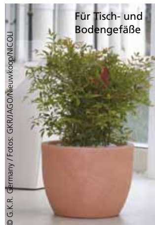
Für Tisch- und Bodengefäße