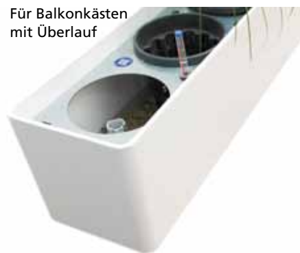
Für Balkonkästen mit Überlauf

Mit Hydro Profi Line® Systemen in die Zukunft!