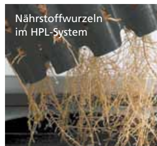
Nährstoffwurzeln im HPL-System

Für ein dauerhaftes und prächtiges Wachstum von Pflanzen!