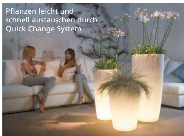
Pflanzen leicht und schnell austauschen durch Quick Change System