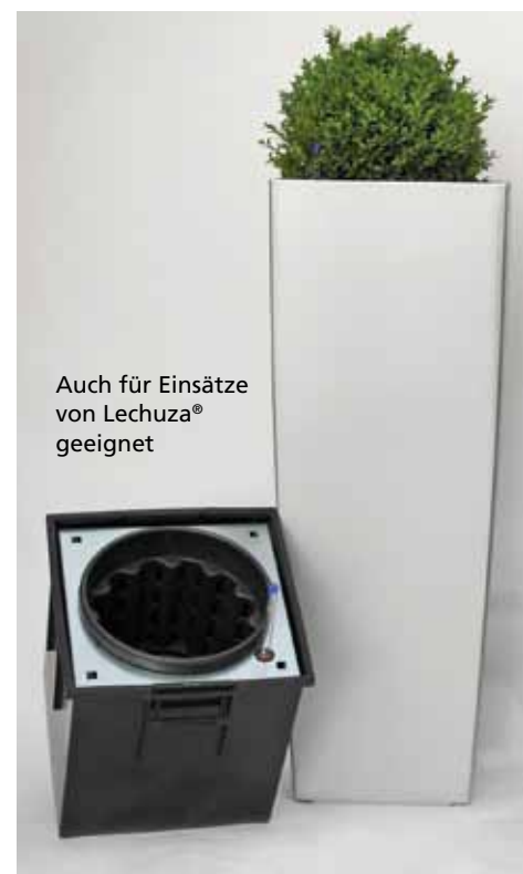
Auch für Einsätze von Lechuza® geeignet